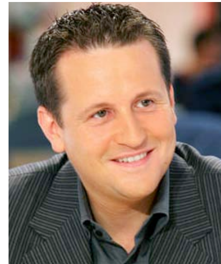
2008 : Rodolphe Belmer (DG de Canal+)