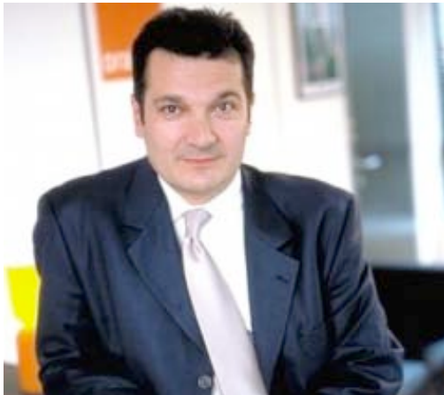
2009 : Didier Quillot (CEO de Lagardère Active)