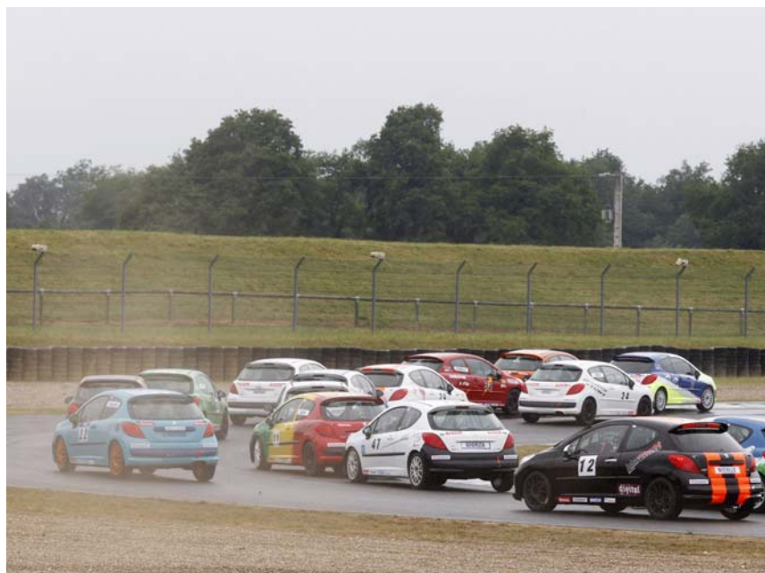
Course Sprint 207