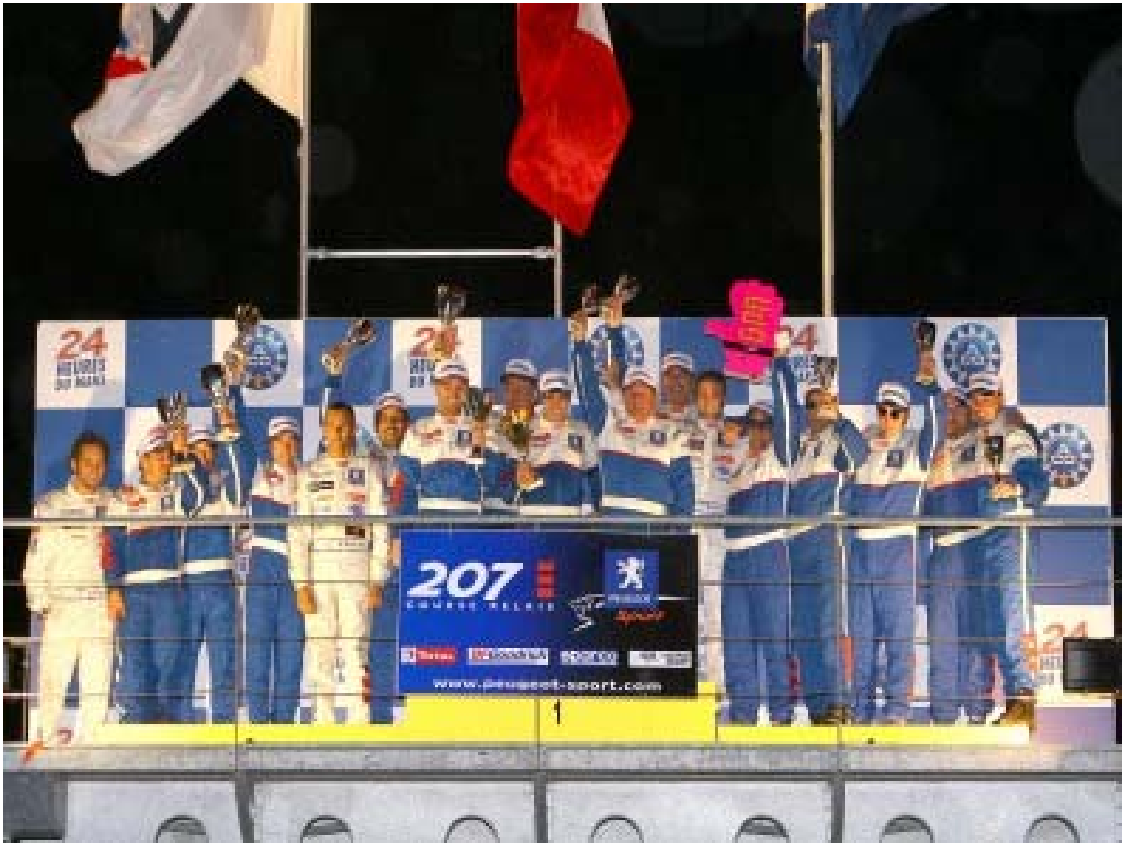
Première place au challenge intersites PSA pour le Team BALEM Sport Auto à SPA-Francorchamp 2010

Les remerciements à la Direction du Site de Carrières-sous-Poissy, à l' USCPCARP et au Comité d'Entreprise pour leur soutien.