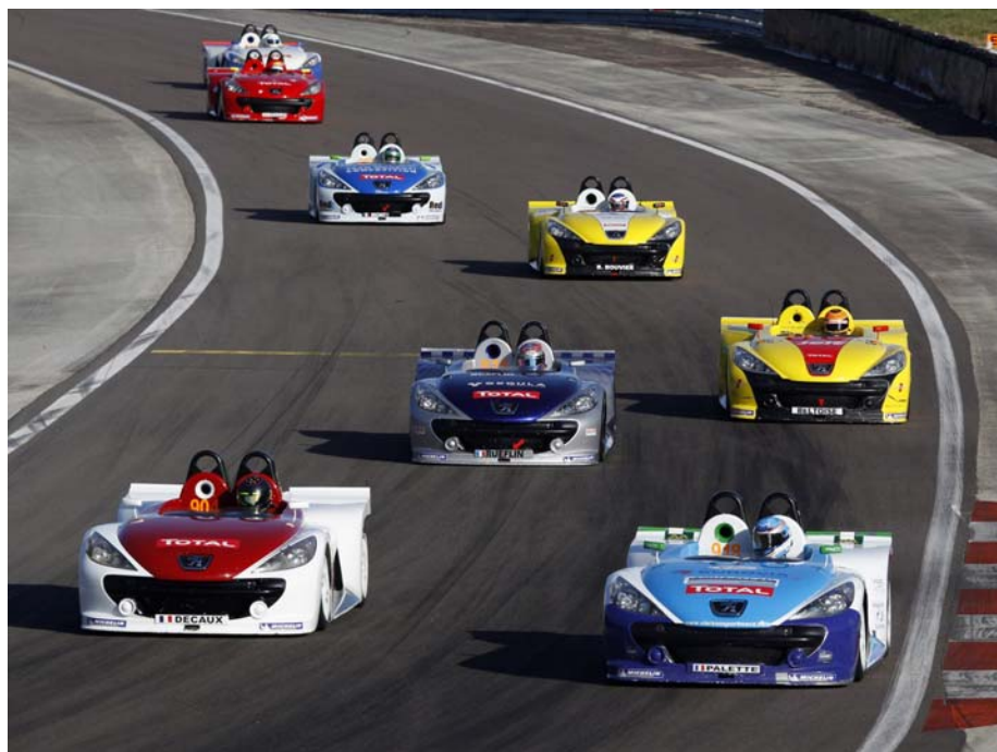
Trophée THP Spider Cup