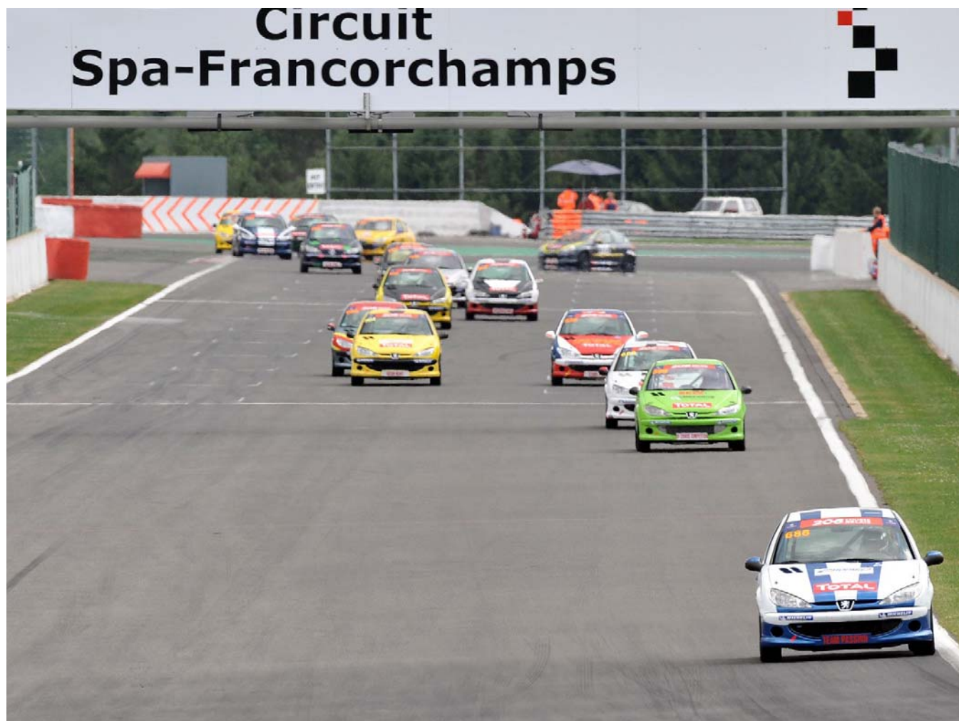
Course Relais 206 Spa-Francorchamp 2010